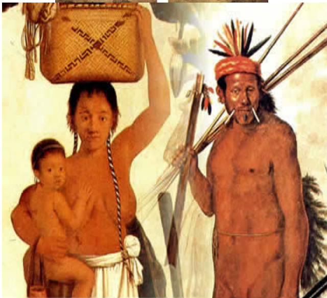
Albrecht Dürer, Adão e Eva